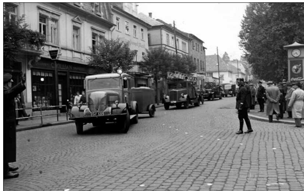
Aus dem Fotoalbum-Archiv der Freiwilligen Feuerwehr – leider ohne Jahreszahl Königsteiner Str./Ecke Kronberger Str. – rechts mit dem Uhrtürmchen vor dem Alten Kurpark.