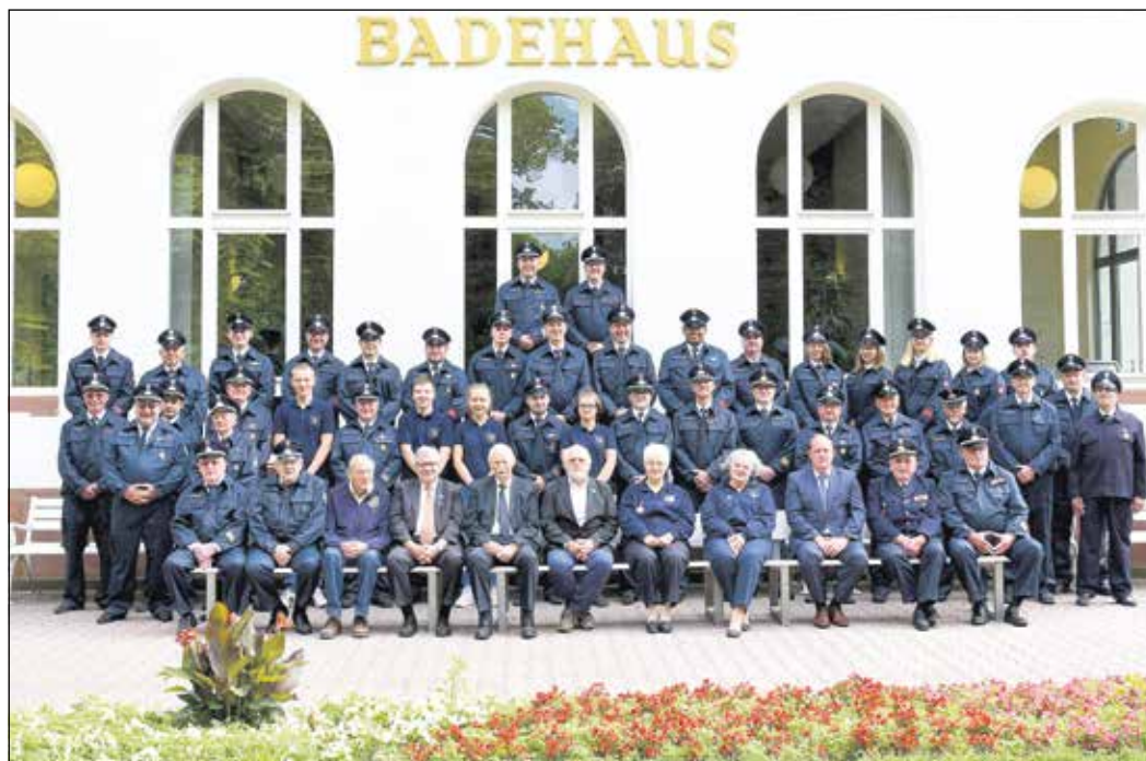
Die heutige Abteilung vor dem Badehaus