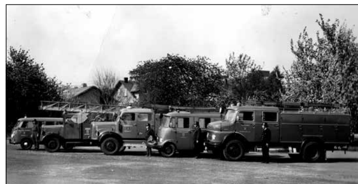
Feuerwehr-Fuhrpark um 1975