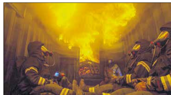
Fortsetzung auf Seite 3 Übungen der Feuerwehr